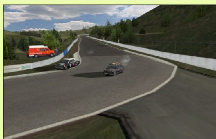
... Qui ressemble fort à une réussite au grand damn de Carlos...