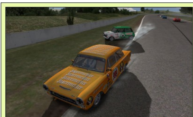
... M'enfin, si on veut, ça ressemble à de la "vengeance"...