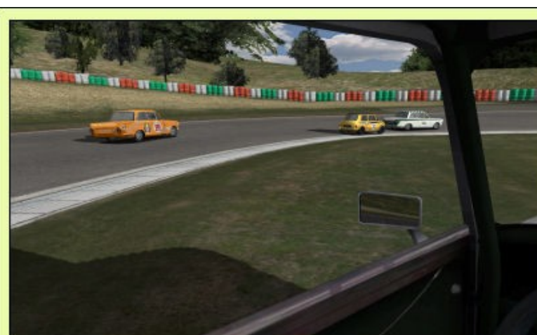
...Et si ça n'en est pas, ben, alors ....