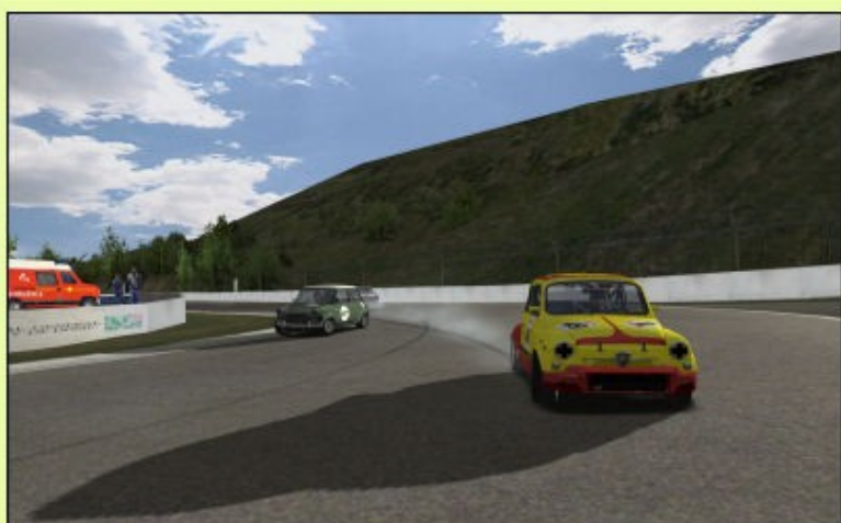
... Mais décidément, il a beaucoup de difficultés à maîtriser cette épingle...