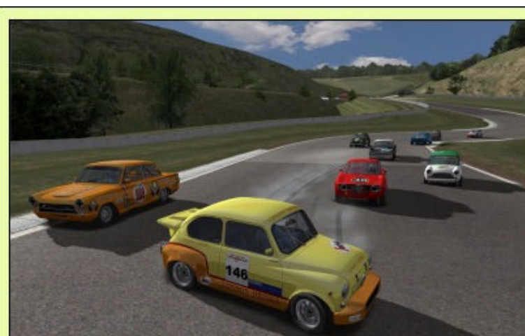
... Et ici, un Phil Stratos en bien mauvaise posture devant une meute de furieux...