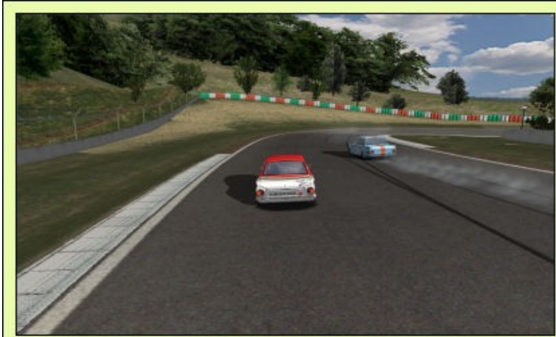
... Pat, gaffe quand même, pas évident de taper un Franck au freinage...