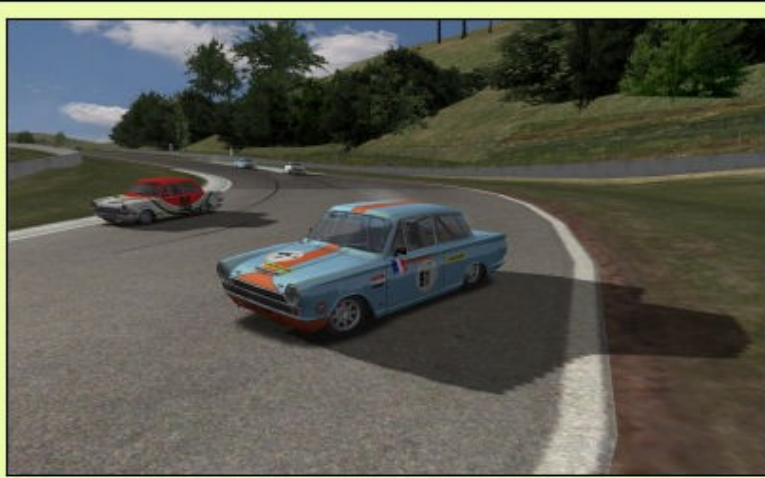
.... Tu vois, t'étais prévenu ....