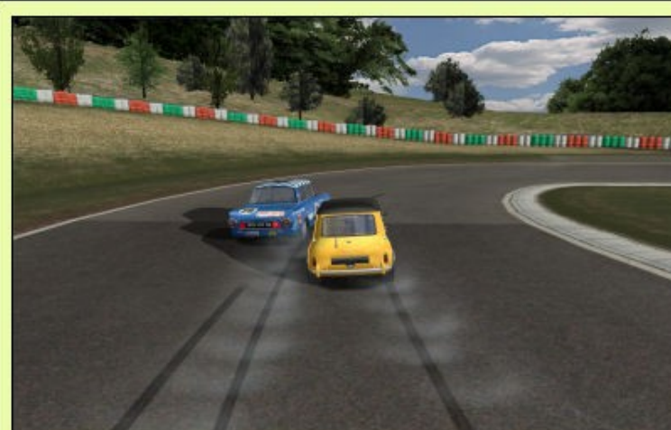
On retrouve Illidan et J. Murph en lutte, lutte qui dure depuis... Holala... Pas mal de temps...