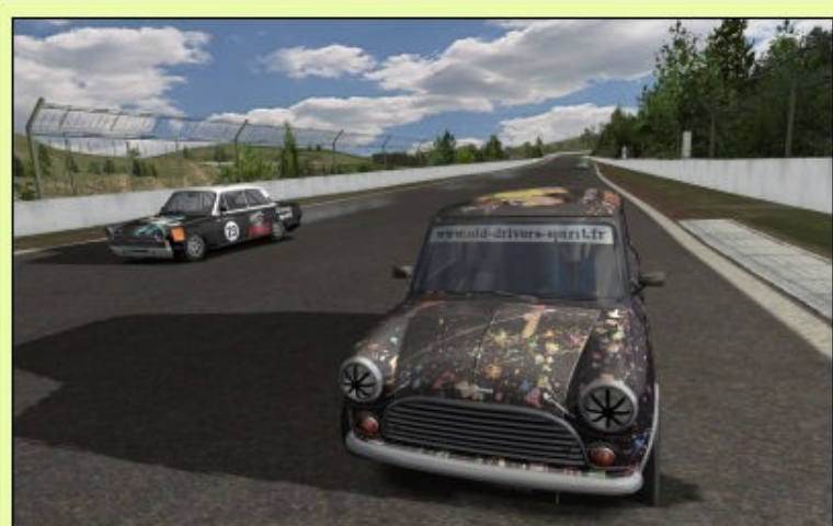
Papy qui tente une action sur Carlos...