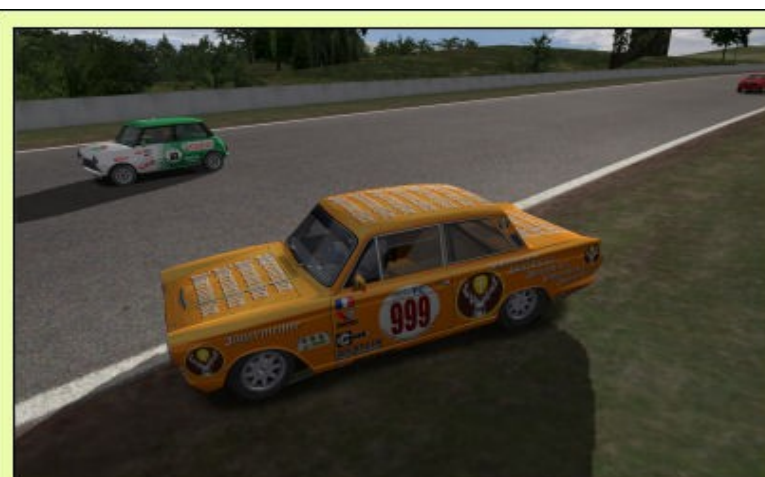
...Magnifique démonstration de maîtrise de target...