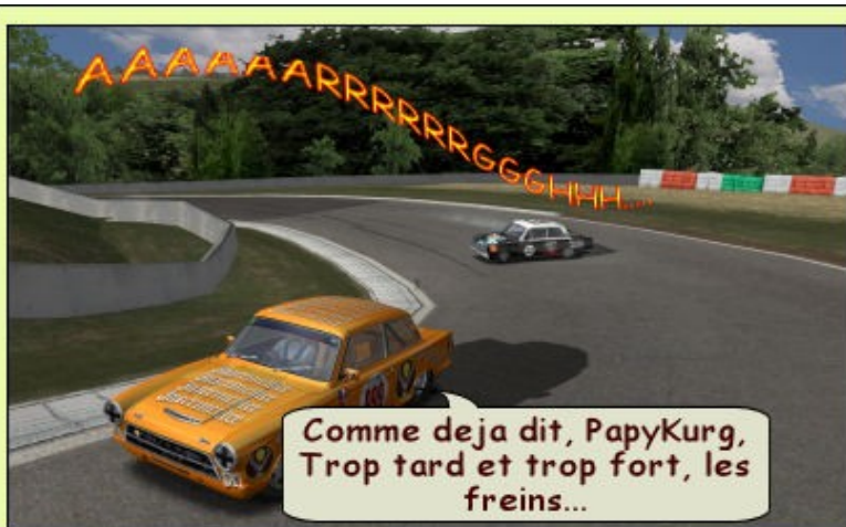
Comme déjà dit, PapyKurg, Trop tard et trop fort, les freins...