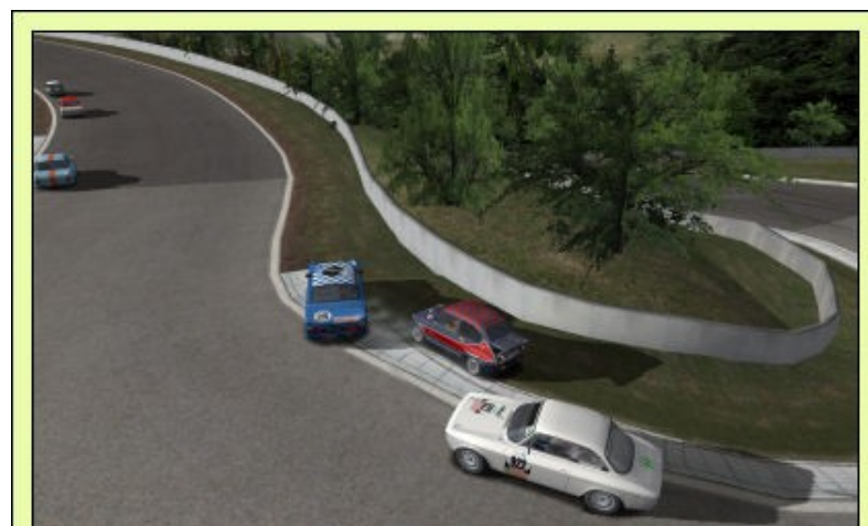
Un des endroits très délicat de Charade, l'épingle "Marlboro", Ildan et Knackko sont allés au "contact" sous les yeux de Jura sur GTA.