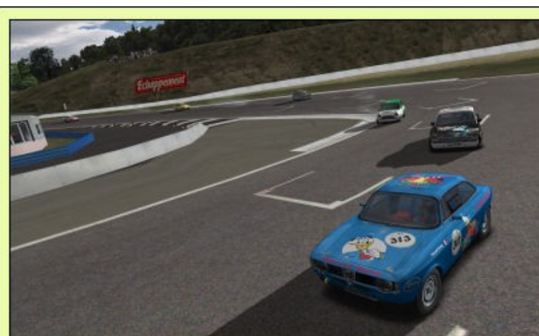
Raynald sous la menace de PapyKurg défend sa position avec acharnement, mais devra céder sous la pression de Papy !