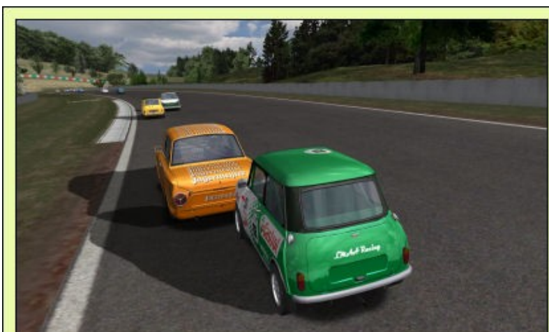
Petite poussette gentilette ...