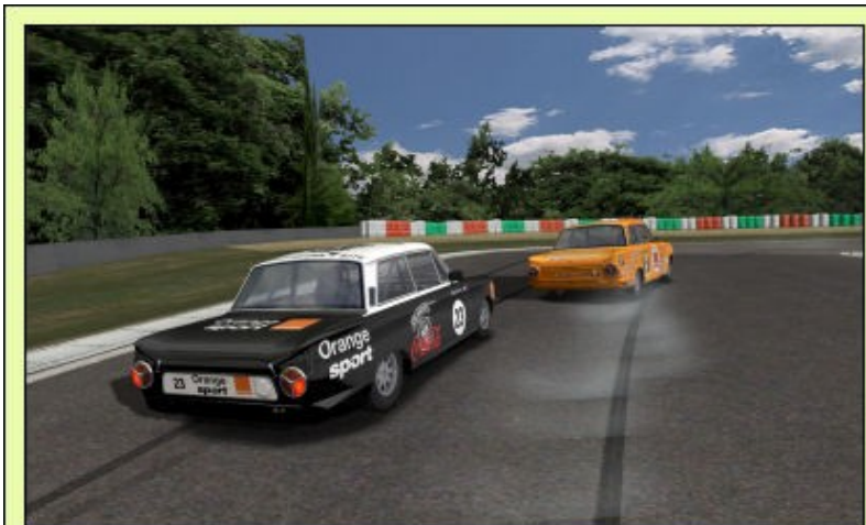
les équipiers, team Koissa !, roues dans roues pour l'instant....