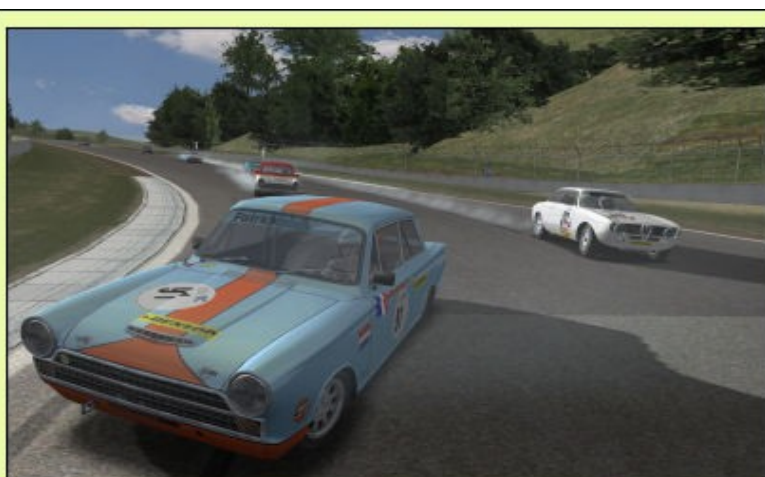
Quel groupe, quelle ambiance, quelle pêche le PiWi, quelle course...