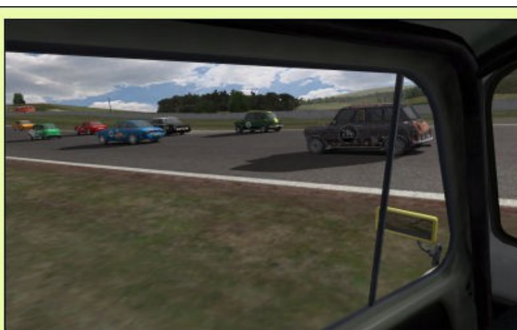
... Phil, perdu !