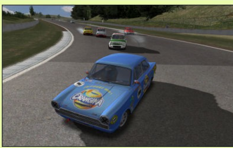
Ptitbras mène la danse devant une meute d'Abarth Coppa1000 !