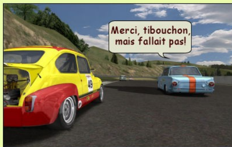
... Bilan, 2 places offertes à Tyrex et Seb_Zorg!